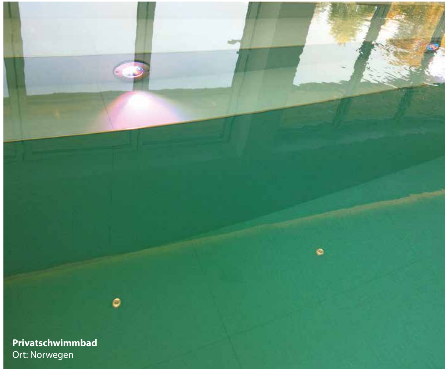
Privatschwimmbad Ort: Norwegen

Die Angaben bezüglich der vorgeschlagenen Produkte und ihre Einsatzmodalitäten werden direkt vom Hersteller geliefert. Für weitere Angaben kann man sich direkt an die technischen Referenten der Herstellerfirmen wenden. Informationen finden Sie unter "Nützliche Adressen".