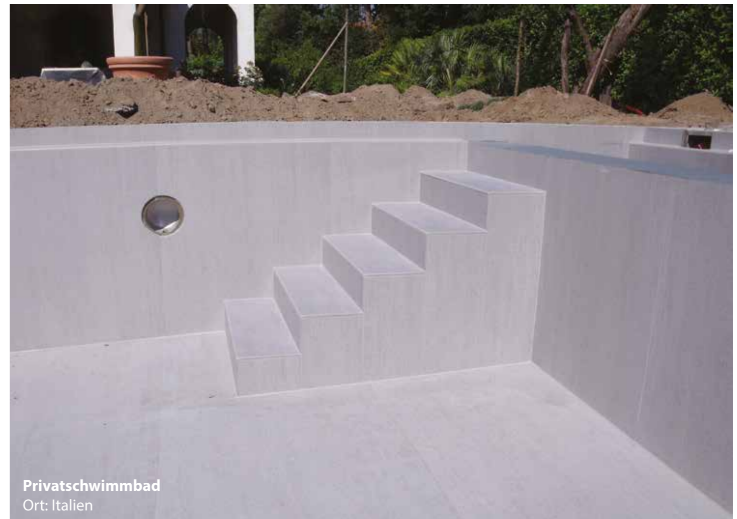
Privatschwimmbad Ort: Italien