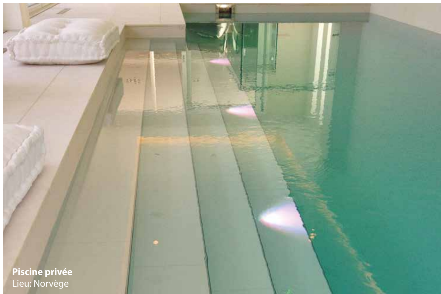
Piscine privée Lieu: Norvège

S'il s'agit de piscines d'eau salée ou thermale, il faudra employer des adhésifs et des mortiers de jointoiement particuliers.