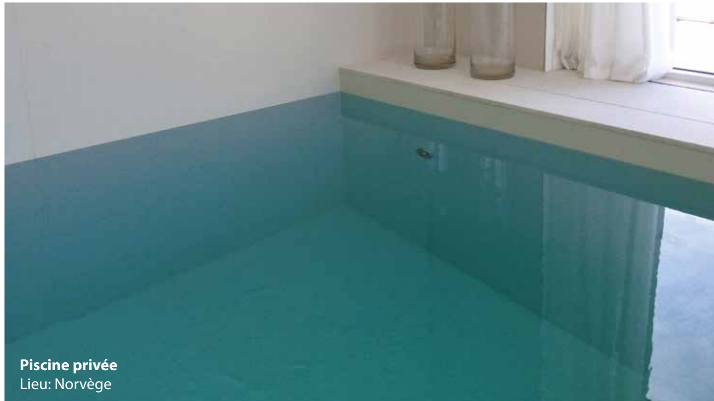
Piscine privée Lieu: Norvège

Si le béton a été travaillé conformément aux indications de la réglementation UNI 11104 (EN 206), correctement mûri, alors, toutes les conditions seront réunies pour avoir un bassin bien étanche et qui ne nécessitera aucun traitement d'imperméabilisation supplémentaire.