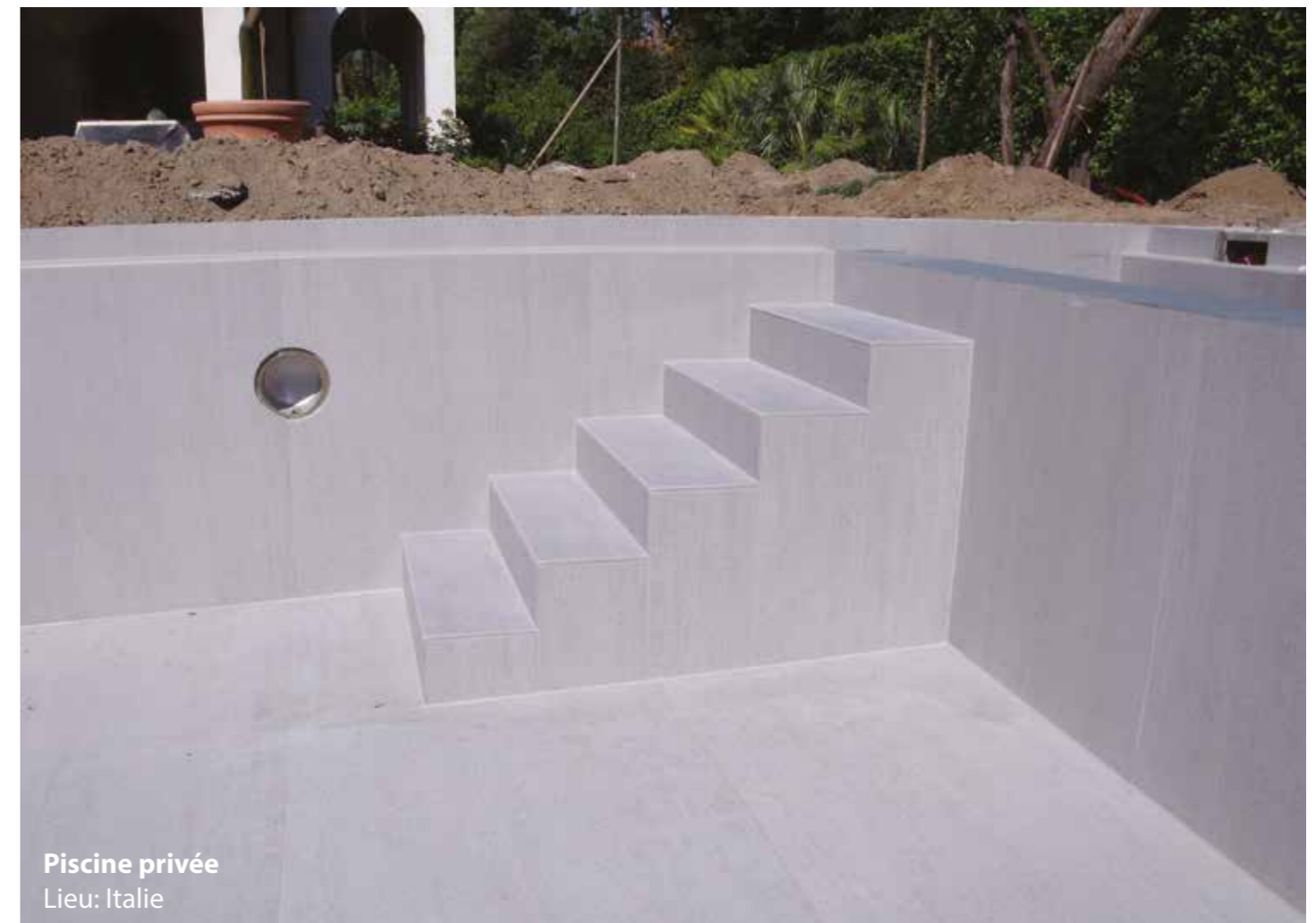
Piscine privée Lieu: Italie