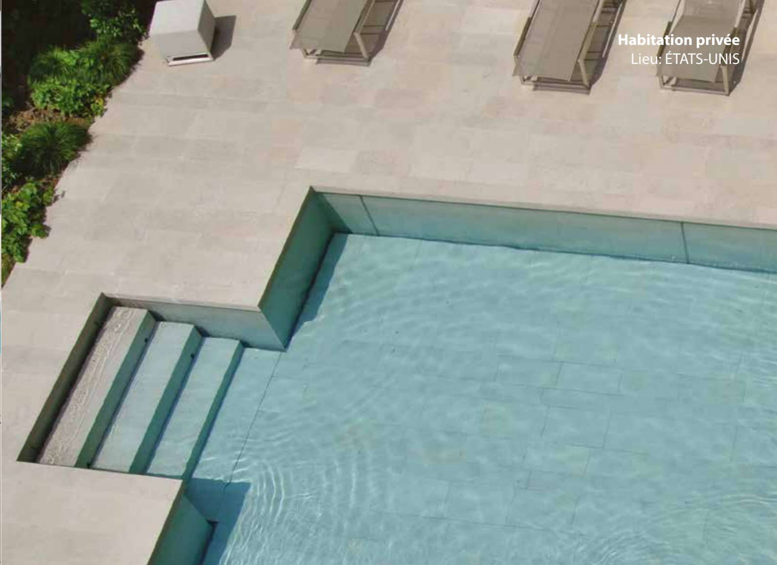
Habitation privée Lieu: ÉTATS-UNIS