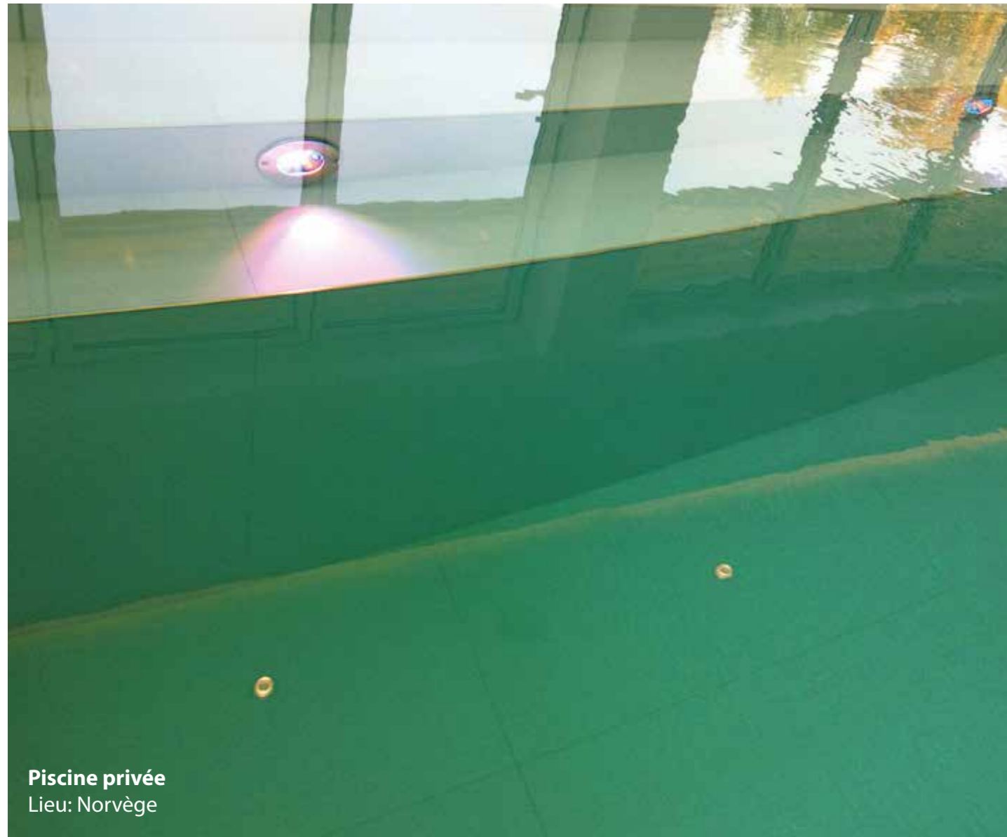
Piscine privée Lieu: Norvège

Les indications concernant les produits proposés ainsi que leur mode d'emploi ont été fournis directement par les fabricants. Pour plus d'indications, il sera possible de contacter directement les personnes de référence des différentes sociétés productrices que nous avons indiquées, dans la rubrique "adresses utiles".