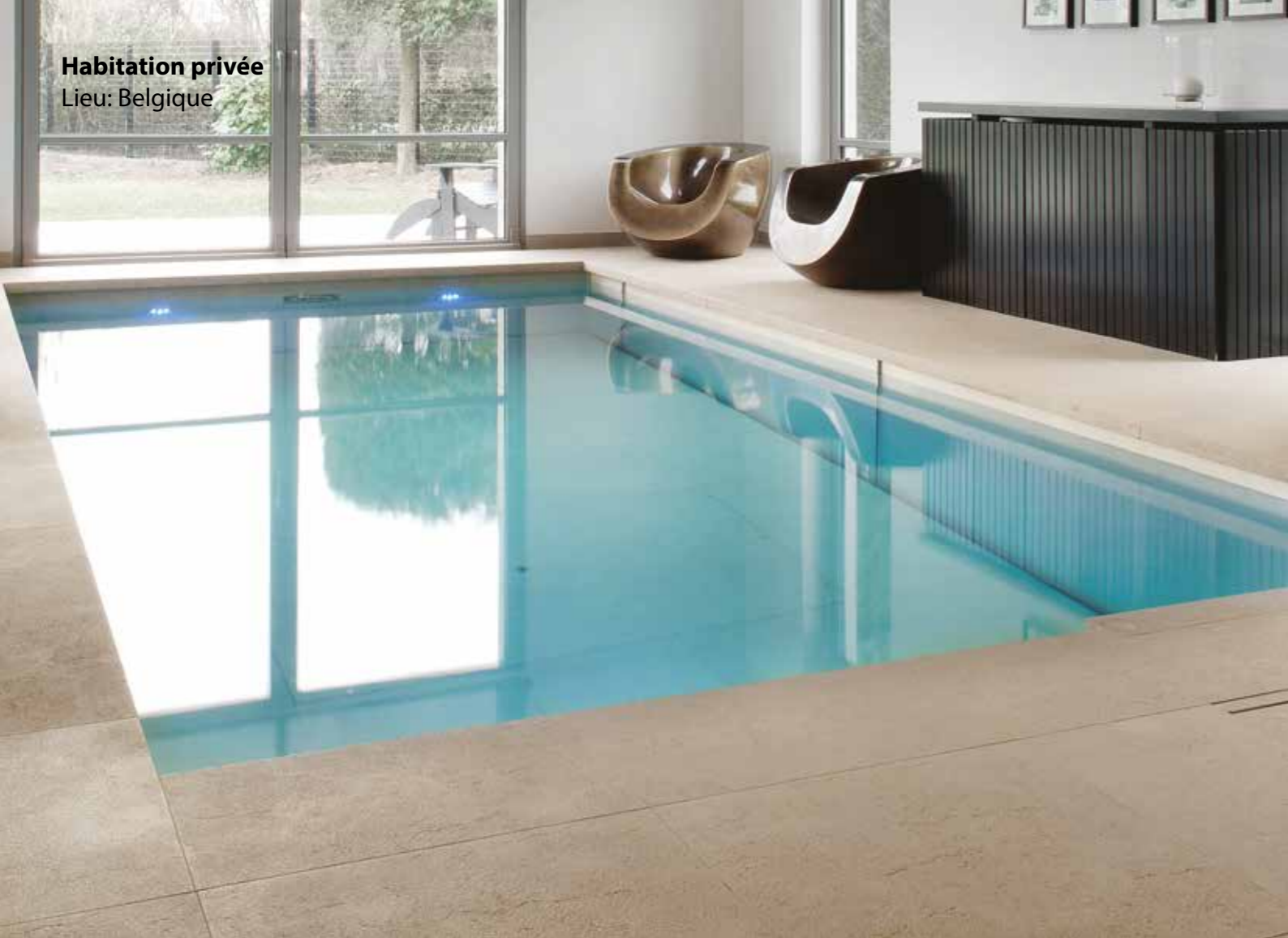
Habitation privée Lieu: Belgique