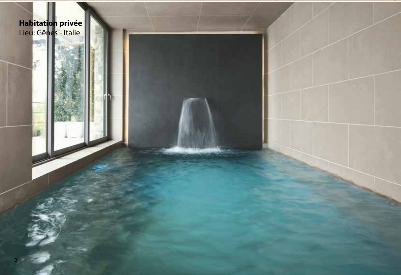
Habitation privée Lieu: Gênes - Italie